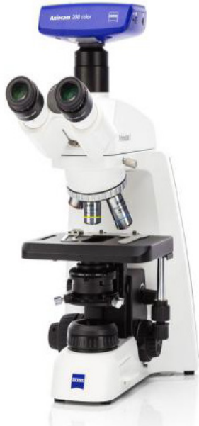
Primostar 3 для викладання та рутинних лабораторних досліджень