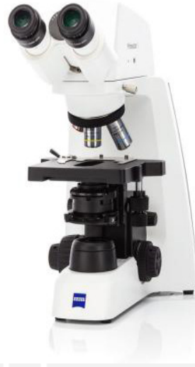
Primostar 3 для навчання

ZEISS Primostar 3 — це надійне рішення для навчальних аудиторій та рутинних лабораторних досліджень, розроблене для інтенсивної щоденної експлуатації. Міцний металевий штатив гарантує стабільну роботу системи протягом тривалого часу навіть в умовах обмеженого робочого простору.