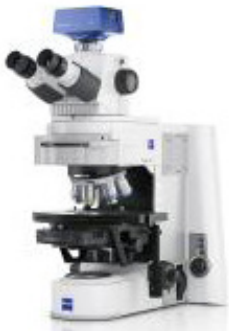
Axio Imager A2