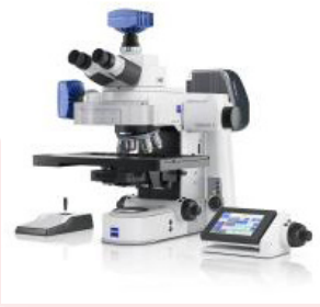
Axio Imager Z2

Axio Imager — модульна платформа прямого дослідницького мікроскопа для високороздільної візуалізації в біології, медицині та промисловості. Відкрита архітектура системи дозволяє гнучко налаштувати її для будь-яких завдань: від рутинного документування та гістології до складного 3D-сканування, кореляційної мікроскопії та аналізу матеріалів.