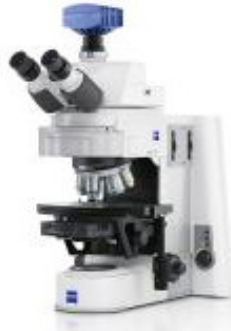
Axio Imager D2