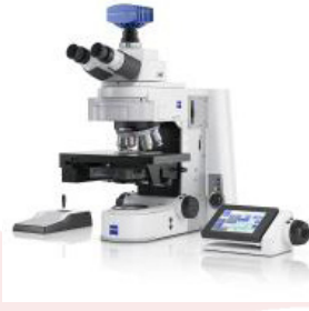
Axio Imager M2